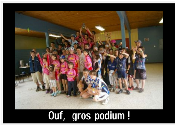
Ouf, gros podium !

C'est sur une note pluvieuse que s'est achevée cette belle fin de semaine, les honneurs du Championnat ayant été remportés par la région de Québec. Comme en témoigne la photo, les coureurs étaient tout sourire au terme des compétitions. Vraiment un bel exemple d'esprit sportif tout au long du week-end, bravo!