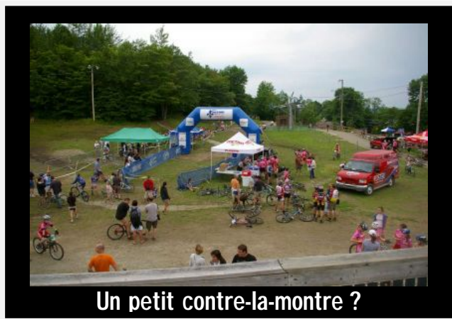
Un petit contre-la-montre ?

La température s'est faite clémente pour l'occasion, malgré les averses annoncées, nous n'aurons finalement eu droit qu'à une petite averse le dimanche pour nous forcer à tenir la cérémonie de remises de médailles à l'intérieur et gâcher le plaisir des bénévoles affectés à la fermeture du site et des parcours.