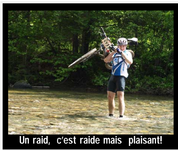
Un raid, c'est raide mais plaisant!

D'abord, avec l'arrivée du site de préinscriptions ( www.competitionsfqsc.net ), qui facilite le processus pour les coureurs, déjà habitués au format, utilisé notamment pour la Coupe du Québec. De plus, le lien plus facile qui s'en suit entre les préinscriptions et l'Équipe Chrono de la FQSC, qui produit les résultats lors de chaque événement. Ensuite, les horaires ont été ajustés de façon à créer une habitude du côté des participants à la série, ce qui rend plus agréable le processus de confirmations d'inscription et de prise de possession des plaques, lesquelles ont aussi fait l'objet d'une standardisation, soit l'adoption d'un cadre commun à tous, ce qui agrément le visuel de la série.