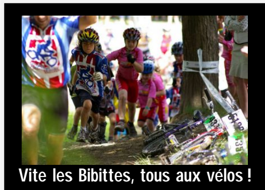
Vite les Bibittes, tous aux vélos !