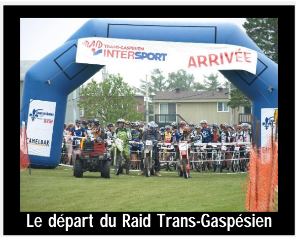
Le départ du Raid Trans-Gaspésien

Sur le terrain, les organisateurs bénéficieront d'une arche gonflable, qui rendra l'expérience plus visuelle à l'arrivée et permettra la recherche de commanditaires locaux, un ajout intéressant pour les comités organisateurs et qui, nous l'espérons, contribuera à la rentabilité des événements, ce qui se traduira par plus de services aux participants.