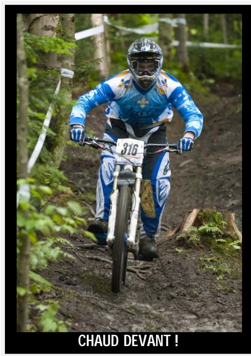
CHAUD DEVANT !